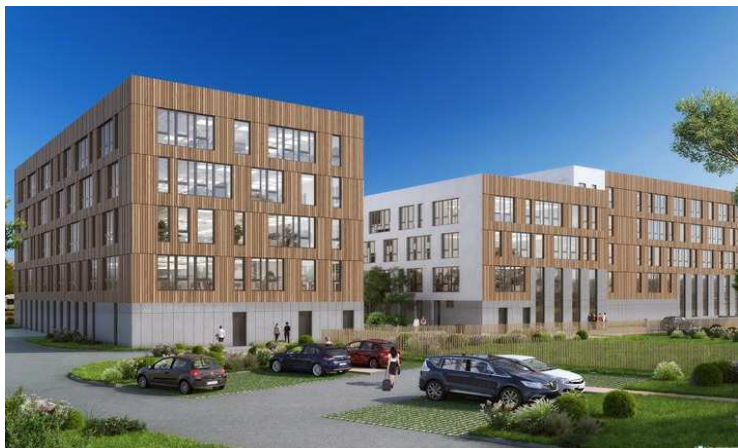
eKNOW - NANTES (44) - Construction d'un ensemble immobilier de bureaux et 248 places de stationnement